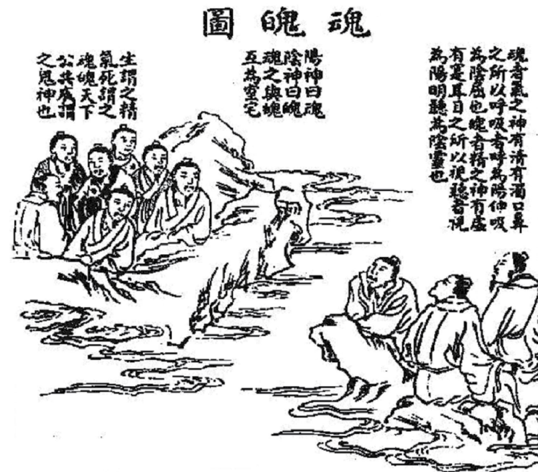
Средневековая гравюра с изображениями душ «хунь» и «по»

вершает действия, а душа-хунь сохраняется в это время в печени. Также считается, что так как душа-хунь связана с печенью, а та — с глазами, то душа-хунь исходит через глаза. Душа-по связана с легкими, а те — с носом и дыханием. Поэтому, она выходит через нос, тогда дыхание во сне становится стабильным и спокойным.