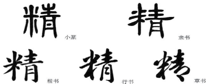
Цзин — эссенция, тонкая энергия, сперматическая энергия, сексуальная эссенция