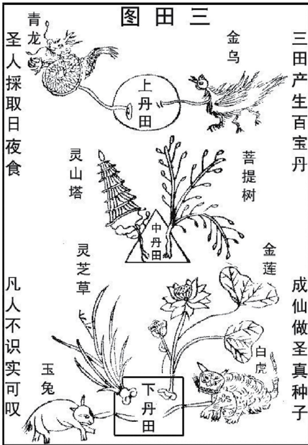
Символическое изображение трех киноварных полей (верхнего, среднего и нижнего)

Помимо духов «хунь» и «по» в теле человека поселяются так называемые «три трупа» или «три червя» (сань ши чун, 三尸虫), которые следует рассматривать, как овеществленное изображение пороков. Они живут в Полях киновари (дань тянь, 丹田): «Старый синий червь» Пан Цзю 彭瑀 живет в Верхнем поле киновари в голове во «Дворце нирваны» 泥丸. «Белая барышня» Пэн Хуэй 彭惠 по прозвищу «Ловушка» живет в Среднем